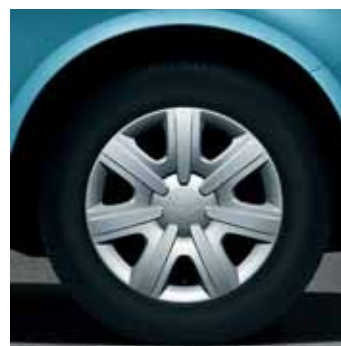
Copricerchi Comoros per pneumatici 5.0J x 14", serie da 4 pezzi (5J0 071 435)