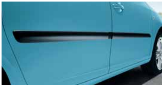
Paracolpi laterali (KGA 700 001)