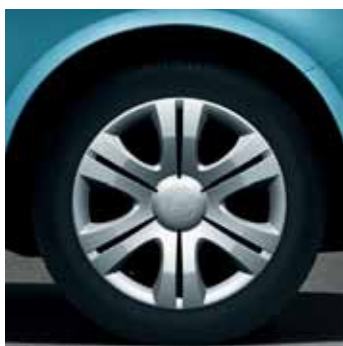
Copricerchi Satellite per pneumatici 6.0J x 15", serie da 4 pezzi (5J0 071 435A)