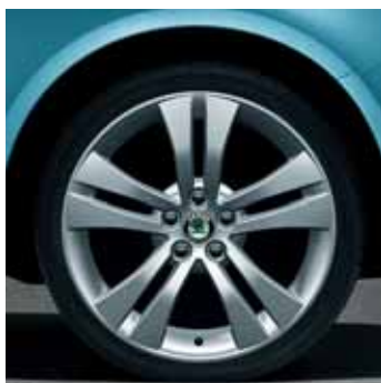
Cerchi in lega 7.0J x 17" Trinity per pneumatici 205/40 R17 (5J0 071 496A)