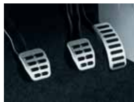
Coperture pedali in acciaio inox (FCA 000 001)