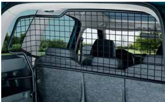
Rete divisoria (DMM 770 001)