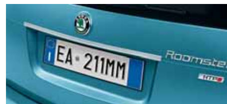
Listello cromato portellone baule (KDA 609 002A)