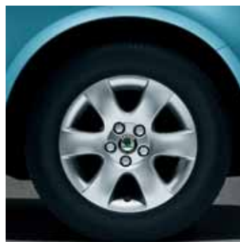
Cerchi in lega 6.0J x 14" Shell per pneumatici 185/60 R14 (CCS 700 002)