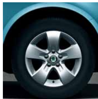
Cerchi in lega 6.0J x 14" Atik per pneumatici 185/60 R14 (CCH 700 003)