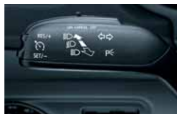
Cruise control per tutte le motorizzazioni (5J1 035 623 per vetture senza computer di bordo, 5J1 035 623A per vetture con computer di bordo)