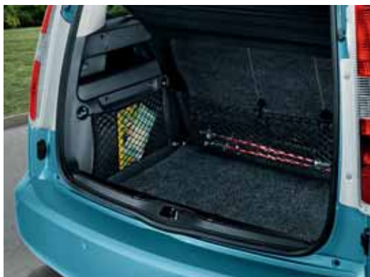
Sistema di reti; reti verticali (DMA 770 002)