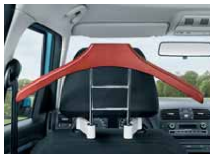
Appendiabiti (3T0 061 127)