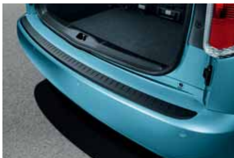
Listello paraurti posteriore (KDA 770 004)