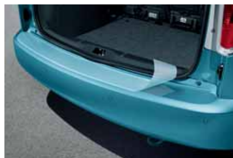
Pellicola protettiva trasparente del paraurti posteriore (5J7 071 133)