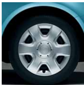
Copricerchi Hermes per pneumatici 6.0J x 15", serie da 4 pezzi (CDB 700 002)