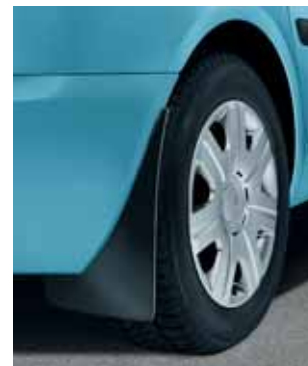
Paraspruzzi posteriori (KEA 770 002), per Roomster Scout (KEA 770 003)