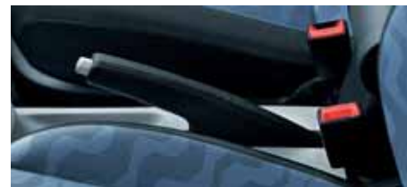
Leva freno a mano in pelle (FFA 700 010)