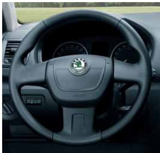
Volante in pelle, 3 razze (FBA 800 001); 4 razze (FBA 800 000 foto non disponibile)