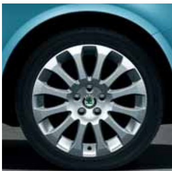
Cerchi in lega 6.5J x 16" Comet per pneumatici 205/45 R16 (5J0 071 494)