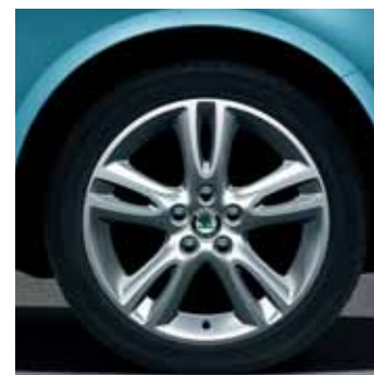
Cerchi in lega 6.5J x 16" Atria per pneumatici 205/45 R16 (CCH 700 006)