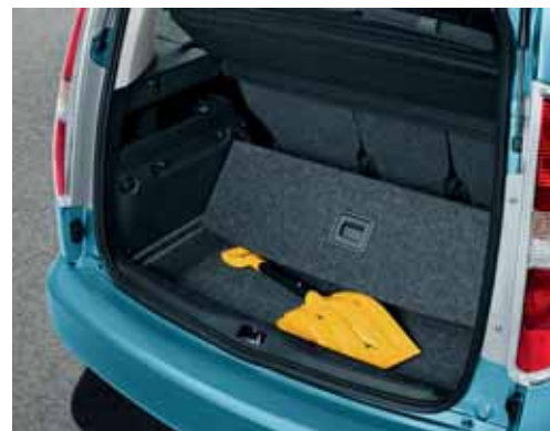
Doppio fondo vano bagagli, 2 parti (DAA 770 001-002)