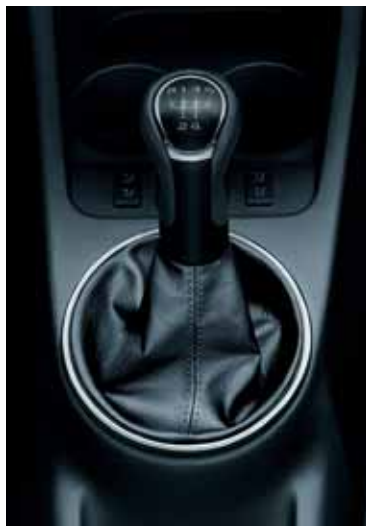
Cuffia del cambio in pelle – decorazioni cromate (5J0 071 667)*