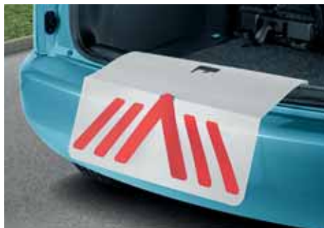
Telo paraurti posteriore (KDX 770 001)