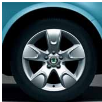
Cerchi in lega 6.0J x 15" Avior per pneumatici 195/55 R15 (CCH 700 005)