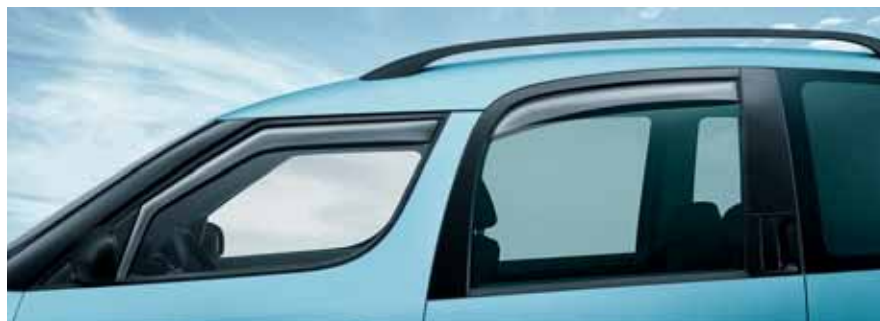
Deflettori finestrini laterali per finestrini anteriori (KCD 779 001), per finestrini posteriori (KCD 779 002)