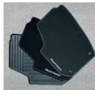
Tappetini, serie da 4 pezzi; tessuto PA (DCA 770 003A), tessuto PP (DCA 770 002A), gomma (DCC 770 00 1A)