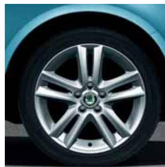
Cerchi in lega 6.5J x 16" Elba per pneumatici 205/45 R16 (5J0 071 494A)