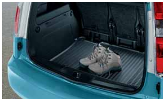
Tappeto in gomma vano bagagli (DCD 770 001)