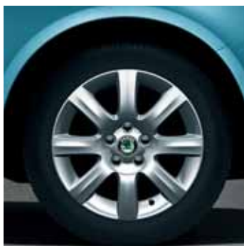
Cerchi in lega 6.0J x 15" Line per pneumatici 195/55 R15 (CCH 700 001)