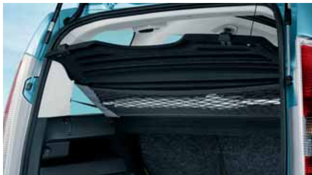
Rete da cappelliera (DMK 770 001)