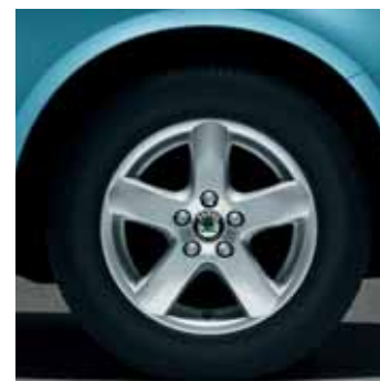
Cerchi in lega 5.0J x 14" Fun per pneumatici 165/70 R14 (CCS 700 001)