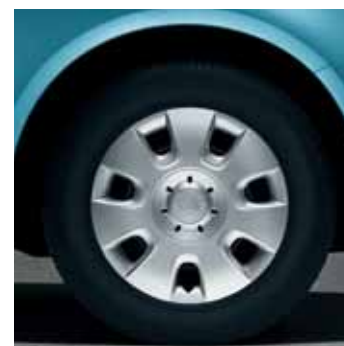
Copricerchi Draco per pneumatici 5.0J x 14", serie da 4 pezzi (CDB 700 003)