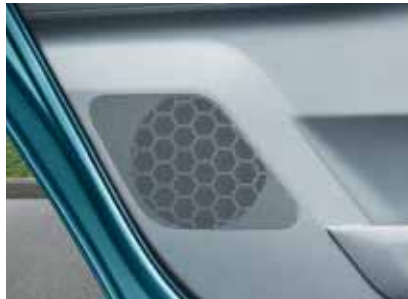
Kit altoparlanti posteriori (ABA 700 002)