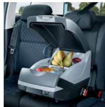
Box frigorifero capacità 15 litri (5L0 065 400)