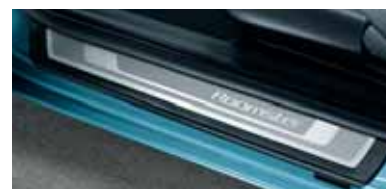
Battitacco con inserti in acciaio inox anteriori e posteriori (KDA 770 002)