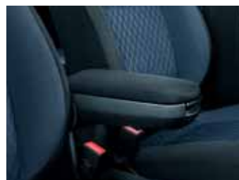
Bracciolo anteriore (DAO 700 001)