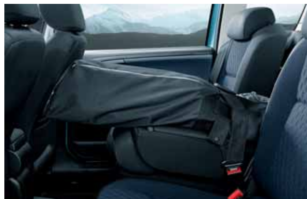
Sacca porta-sci, per 2 paia di sci (DMA 630 004)