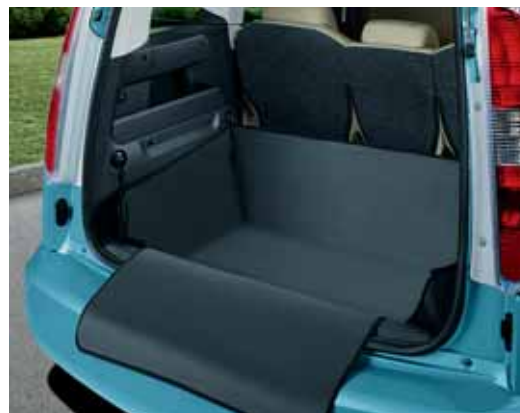
Telo vano bagagli impermeabile (DMK 770 002)