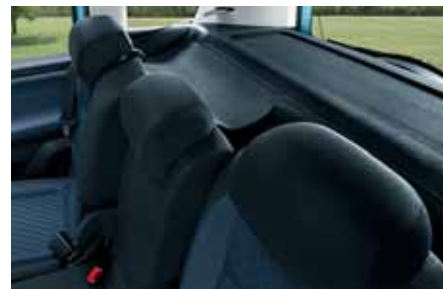
Copertura vano bagagli dietro ai sedili posteriori (DMK 770 005)