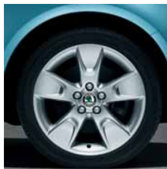
Cerchi in lega 6.5J x 16" Bear per pneumatici 205/45 R16 (CCH 700 002)