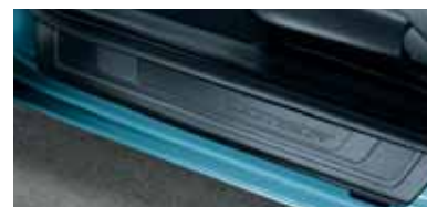
Battitacco in plastica nero (KDA 770 001)