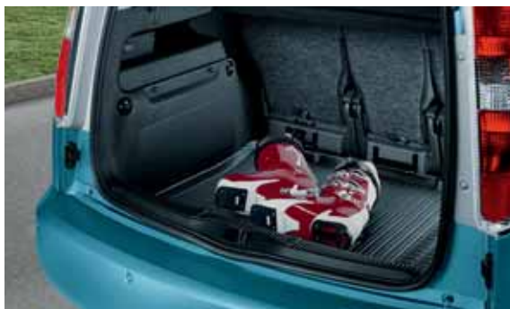
Vasca bagagliaio (DCE 770 001)