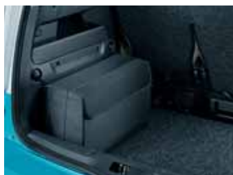
Borsa per vano bagagli (DMK 770 003)