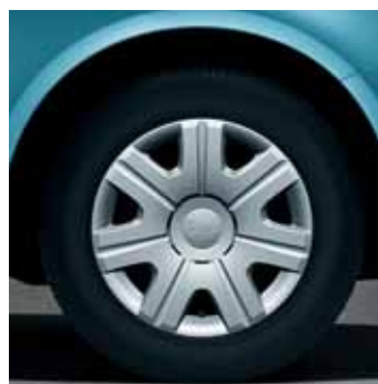
Copricerchi Castor per pneumatici 6.0J x 14", serie da 4 pezzi (CDB 700 004)