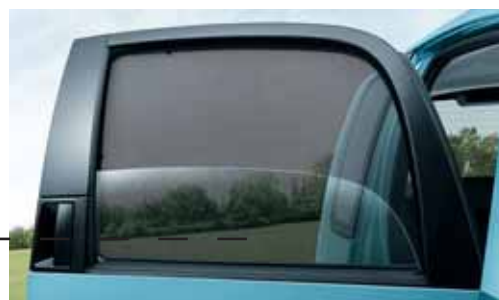
Tendine parasole finestrini posteriori (DCK 779 001) Tendine parasole (foto non disponibili) per: - finestrini a lunotto posteriori (DCK 779 002) - lunotto (DCK 779 003)