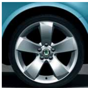
Cerchi in lega 7.0J x 17" Kentaur per pneumatici 205/40 R17 (5J0 071 496)