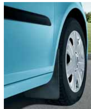
Paraspruzzi anteriori (KEA 700 001)